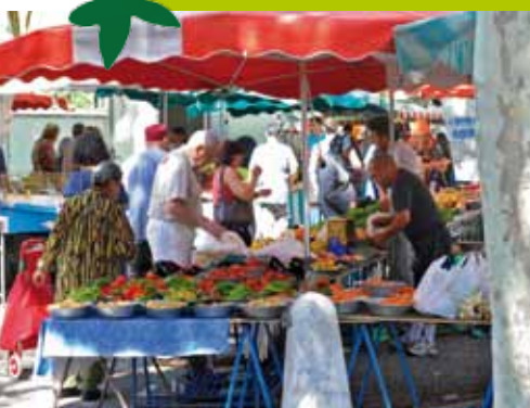
Marché de Vaise Lyon 9 e

Le long de la Saône, c'est tout un paysage bucolique qui s'offre à la vue des riverains et des promeneurs, marqué notamment par la beauté sauvage de l'Île Barbe. Entouré de verdure, préservé de toute agitation, le quartier de Saint-Rambert ferait presque oublier son appartenance à Lyon.