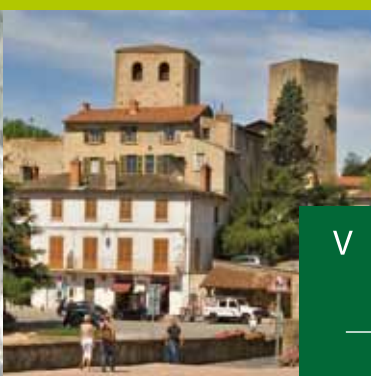
Village de Saint-Cyr au Mont d'Or