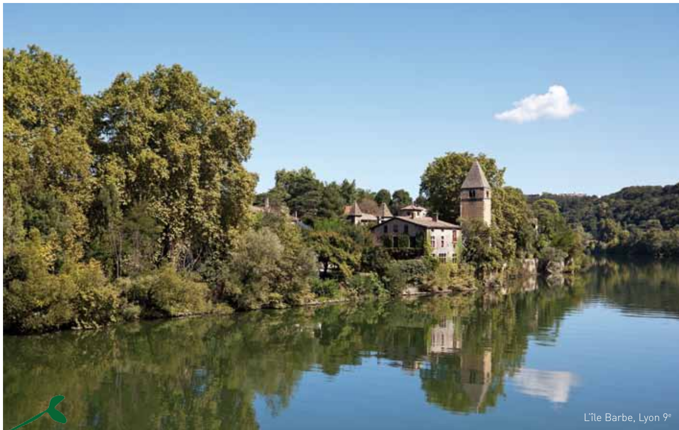
L'île Barbe, Lyon 9 e