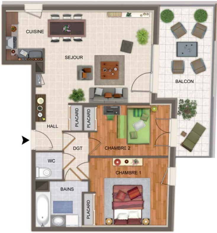
Exemple de 3 pièces de 66,44 m 2 Balcon 17 m 2