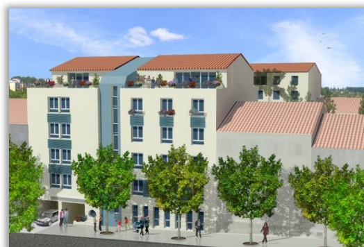
Perspective de la résidence