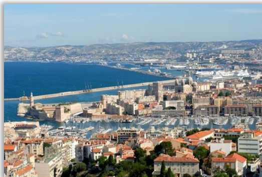
Le Port de Marseille

La « Cité Phocéenne » bénéficie d'un climat typiquement méditerranéen et d'une durée exceptionnelle d'ensoleillement. Elle possède de nombreux atouts : la mer, le soleil, la nature et la culture.