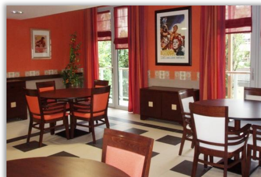
Exemple de prestations