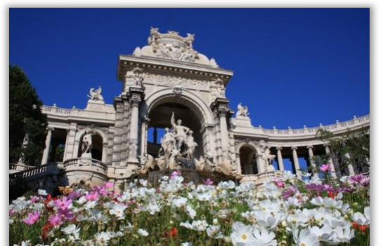
Le Palais Longchamp

Idéalement située dans le quartier des Cinq avenue , rond-point réputé pour ses nombreux commerces, la résidence se trouve à quelques minutes à pied de la Gare SNCF de Marseille et des lignes de métro 1 et 2 et à moins de 4 km de l'autoroute A50.