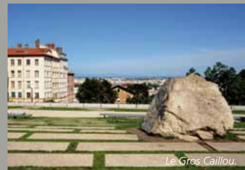
Le Gros Caillou.

C'est dans ce quartier historique très estimé des lyonnais, que COGEDIM réalise un ensemble architectural haut de gamme, baptisé « Croix-Rousse Lyon 4 en Aparté ».