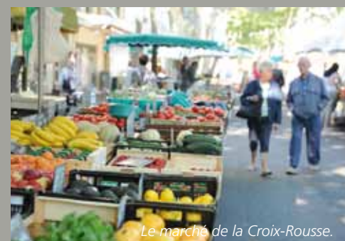
Le marché de la Croix-Rousse.