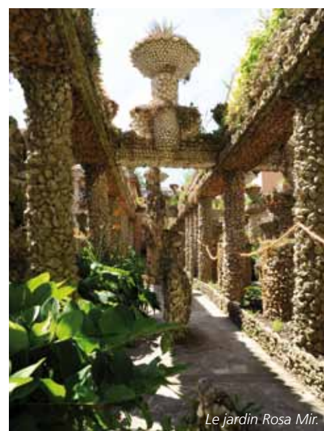
Le jardin Rosa Mir.

19 e siècle qui organise régulièrement des conférences littéraires et philosophiques. En outre, la place du commandant Arnaud et son jardin d'enfants, le Jardin Rosa Mir, l'esplanade du Gros Caillou et le jardin d'Ivry invitent aussi à d'agréables moments de détente et de promenade au cœur de la Croix-Rousse. Par ailleurs, le Parc de la Tête d'Or situé à quelques minutes de là, offre un véritable havre de verdure au cœur de la ville.