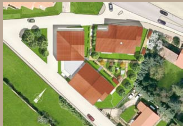
Plan masse de la résidence